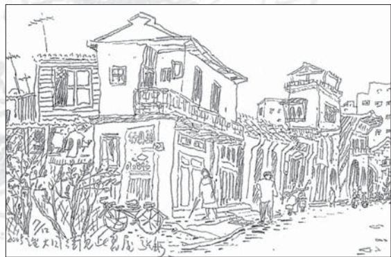
↑ 〈改建前的大同街老房屋〉簽字筆 13×19cm / 2005

於是，在「中心新村」巷口取景，現場可見的空間環境，加上個人主觀的時間因素，速寫成了〈明月幾時有〉。畫面右下角，縱橫交錯的線條，表現的是因為颱風掃過，等待清運的亂象。但請不要問我，柏油馬路怎麼冒出這麼多小草？溫泉公寓怎麼移了位置？巷子裡的樹怎麼都長高了…。甚至還要很生氣地說：「月亮不可能掛在那兒。」取景，取景，並非被景取走了呀！