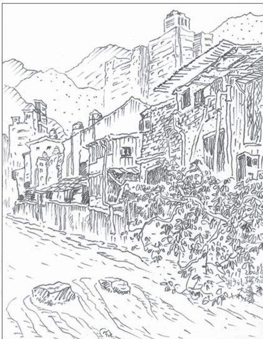
↑ 〈溪邊的巷弄〉簽字筆 19×26cm / 2008

最後提出兩張平時在附近塗鴉的類似速寫，作為本輯專題最單純和誠摯的回應。但願北投區的巷巷弄弄，永遠平靜、美好！