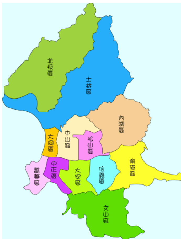
圖一：台北市行政區域圖

然後順著學會的經營特質，並能運用有經驗的在地社區工作團隊，就近輔助社區發展協會學習組織自主經營的方法與技巧，且將台北市十二行政區組合為東西南北等四個區域，東西南北所包括之行政區域是依市府施政習慣，在東區有松山、內湖與南港，西區有萬華、大同與中正，南區有文山、大安與信義，北區則有北投、士林與中山等行政區（如圖一）。