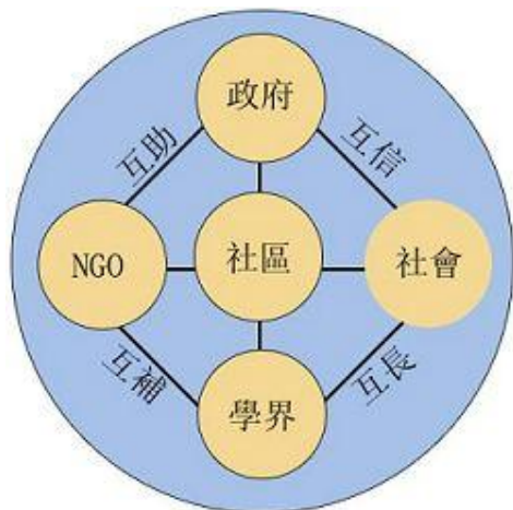
圖二：以社區為軸心的夥伴關係圖

願景實踐的操作有其複雜度，他需要有核心的倡導群，需要社區相關人士的行動支持，也需要跨領域的合作，形成夥伴關係〈圖二〉。而如何整合是一個高難度的技術與藝術，因此，廣結善緣是很重要的，讓更多人可以參與，讓人在實際的操作過程中感受、體驗、學習，甚至接受錯誤與衝突的發生，然後以願景價值為核心，再尋求新的認同，願景引領下的社區營造與地方動員，其可貴處也在此。